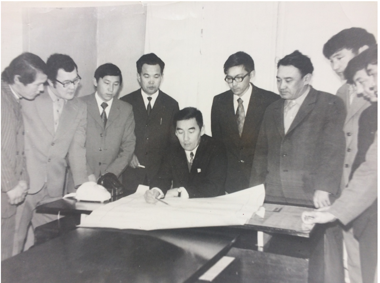
Геологи обсуждают новую разведочную структуру.